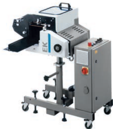
Plieuse à couteau EK 300 pour pli croisé.

Des plieuses automatiques combinées et des plieuses automatiques à poches pour des formats allant de 6 à 6,5 cm jusqu'à 74 à 104 cm - plus de 100 modèles disponibles. Dispositifs de publipostage de toutes sortes. Machines spéciales sur mesure en fonction du souhait du client. Interrogez-nous. Nous apporterons une solution à vos problèmes de pliage.