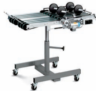
Recette en écaille