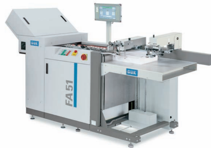
FA 51 AUTO

Plieuse à réception en écaille et alimentateur à pile plate. Disponible avec 4 ou 6 poches à pliage automatique.