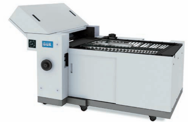
FA 51 Station II

Margeur à pile plate avec déchargement des feuilles par le haut. Table d'alignement de conception antistatique. Régulation numérique et électronique de la distance entre les feuilles. Tête de séparation avec ventilateurs latéraux. Entraînement indépendant en option, plate-forme mobile, unité de transfert courte à la place de la table d'alignement (opt.)