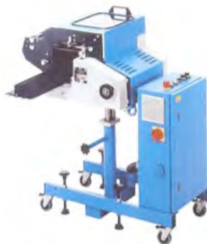
verticale KS pli minia-