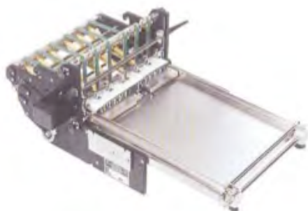
Sortie 310 pour ture.