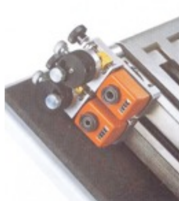
Nouvelles poches combinées